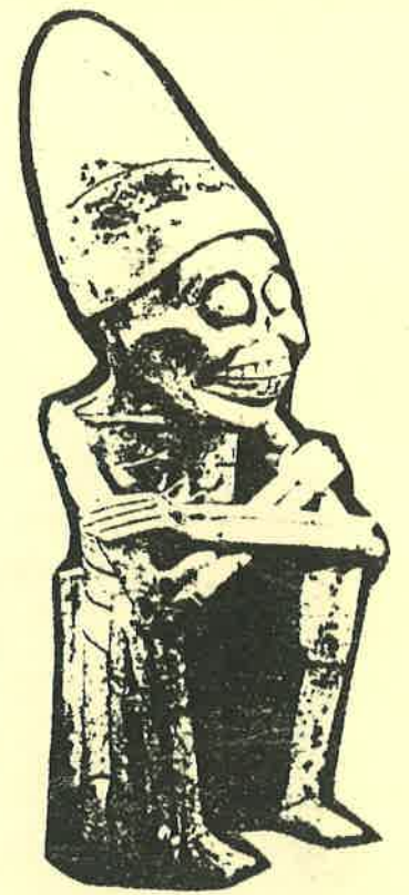
Dios pre-hispano de la muerte, Mictlantecuhlti, cultura totonaca, siglos VI y IX, A.D.

El festival mexicano de los Días de los Muertos tiene sus orígenes tanto en los rituales mortuorios pre-hispanos como en los elementos de la iglesia católica-romana introducidos durante el período colonial. Las crónicas de los historiadores españoles del siglo XVI establecen que las poblaciones indígenas celebraban sus fiestas de los muertos a lo largo de un período de varias semanas, durante nuestros meses calendarios de agosto y septiembre. Su propósito era el de rendir honores a sus antepasados y a los espíritus de los niños con ceremonias y ofrendas de comida, bebidas, incienso y flores para sustentarlos durante su viaje al más allá. Los misioneros españoles sabían que la conversión de estos nativos a la fe cristiana no iba a poder erradicar estos rituales, por lo tanto, permitieron que dichos festivales fueran transferidos a las festividades cristianas para celebrar a los muertos: Día de Todos los Santos, noviembre 1º y Día de los Difuntos, noviembre 2.